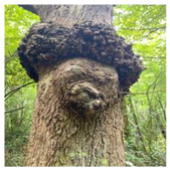
Arbre ancien de la réserve biologique sensible du Boucau. Propriété du Département des Pyrénées Atlantique