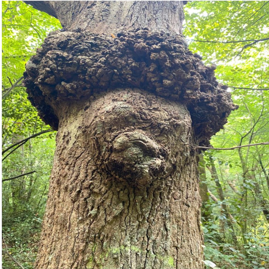
Arbre ancien de la réserve biologique sensible du Boucau Propriété du Département des Pyrénées Atlantiques